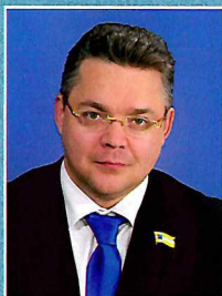
Владимир Владимиров: ИНВЕСТИЦИИ В ЗДРАВООХРАНЕНИЕ – ЭТО ВКЛАД В БУДУЩЕЕ СТАВРОПОЛЬЯ стр. 75