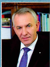
Евгений Шляхто: МОЙ ОТВЕТ НА ЗАПРОС ТЕКУЩЕЙ СИТУАЦИИ – МНОГОПРОФИЛЬНОСТЬ стр. 20