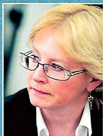
Вероника Скворцова: ОБЛАСТЬ ОСОБОГО ВНИМАНИЯ стр. 8